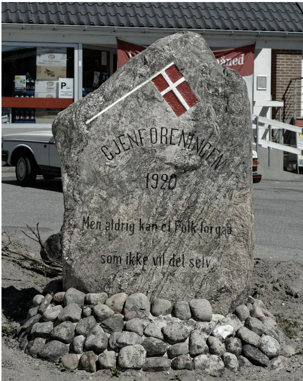
Nimtofte-stenen efter nyopmaling, juni 2018.

Indskriften er hugget af J. P. Jacobsen, Mørke.