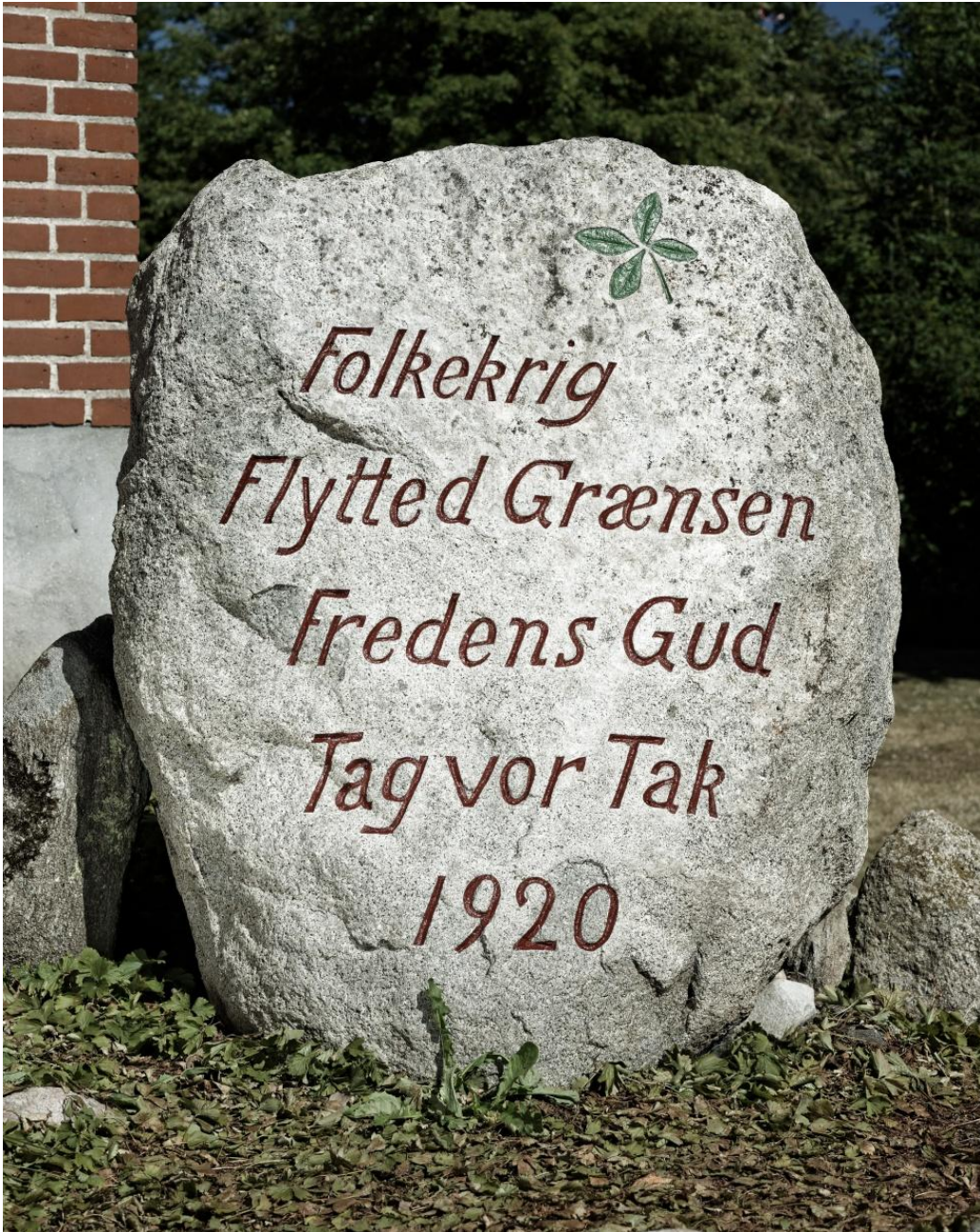
Hvilsager-stenen efter genopmaling, juni 2018

Stenens indskrift er hugget af J. P. Jacobsen, Mørke.