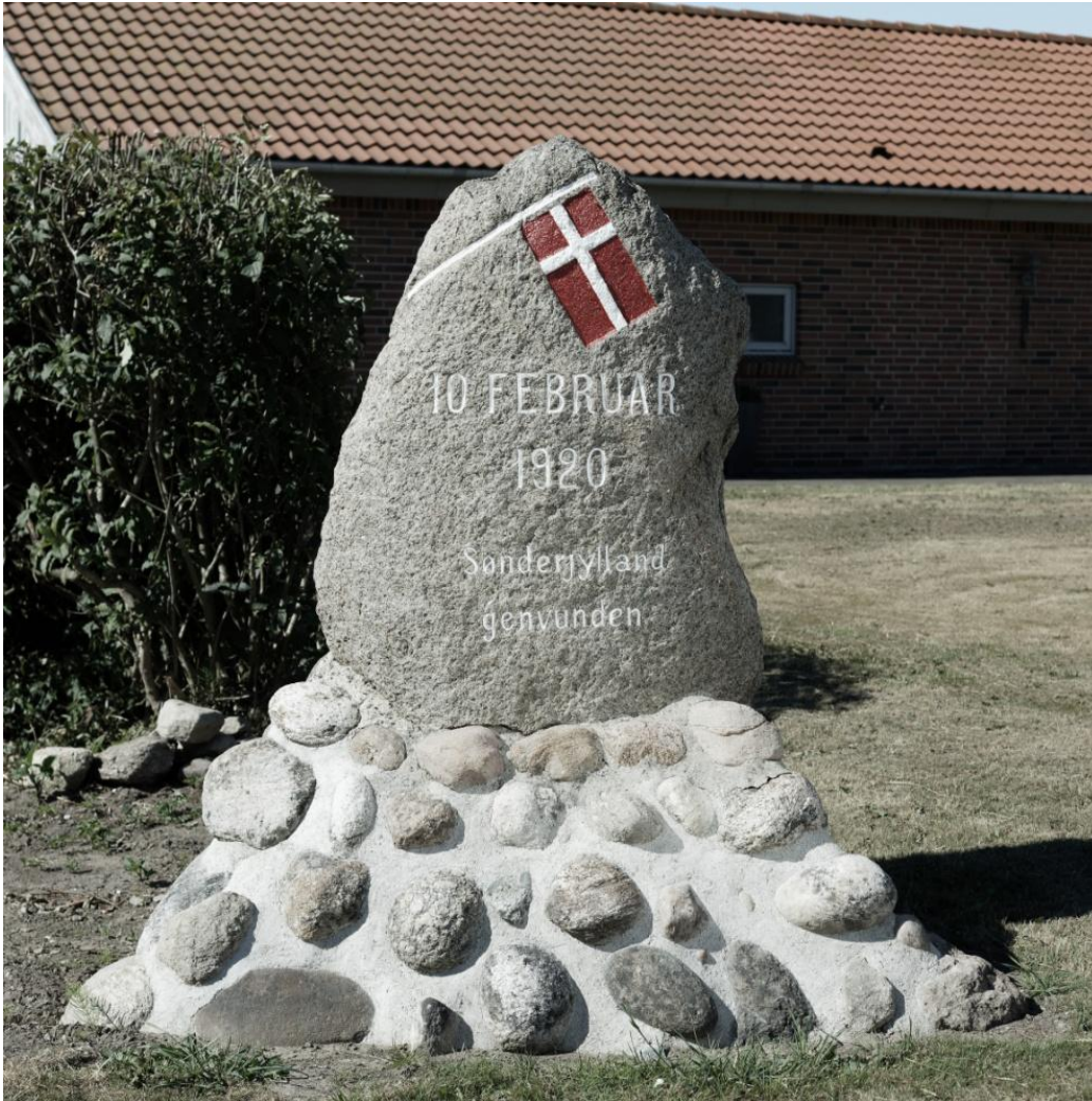
Syvveje-stenen, nyopmalet og med genmuret røse, juni 2018.

Indskriften er hugget af J. P. Jacobsen, Mørke.