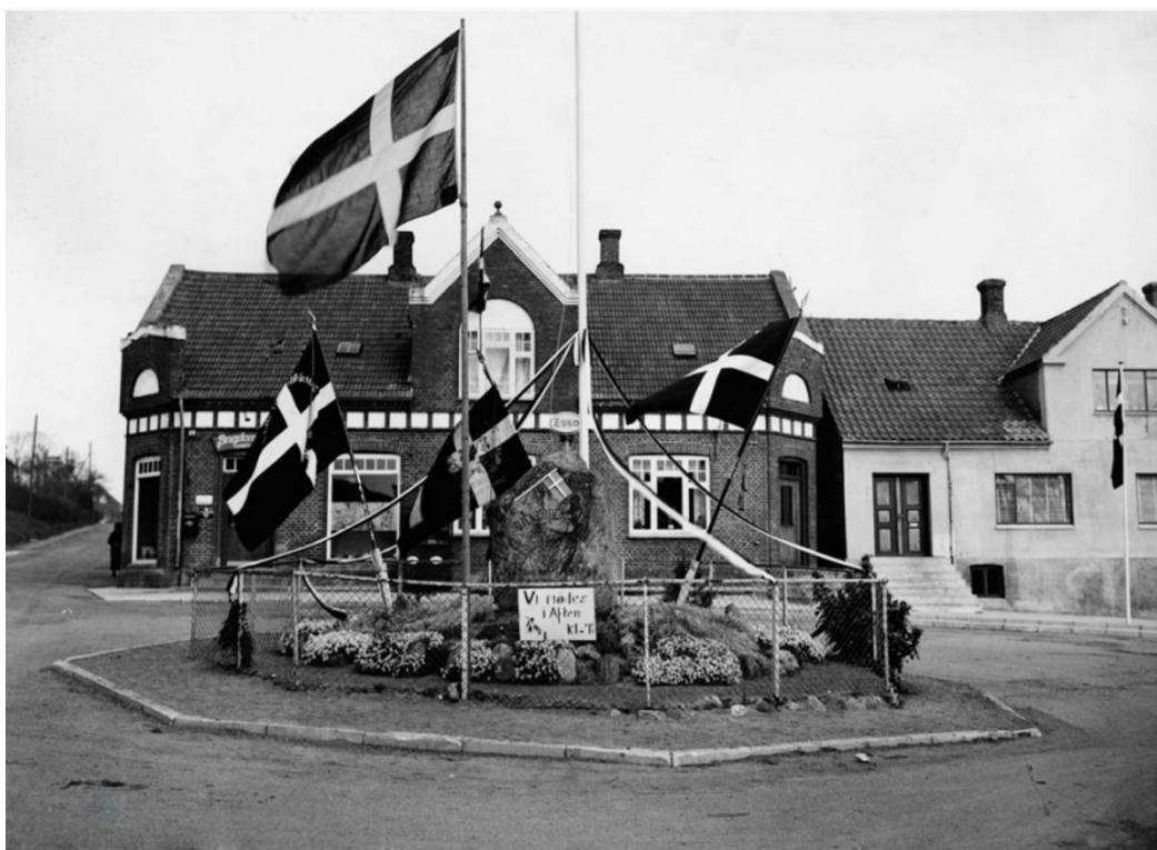
Figur 5, Nimtofte-stenen på befrielsesdagen 1945.

Dannebrogssflaget er blevet genopmalet med to lag Permanent rød og Antikhvid linoliemaling, mens indskriften er genopmalet med to lag sort linoliemaling. Malingen er fra Linoliebutikkern i Højbjerg, Aarhus. Da ikke al overskydende maling har kunnet fjernes, ser indskriften lidt "ulden" ud i kanterne. Der er desuden et farvesammenfald mellem stenens mørke mineraler og den sorte maling, der ligeledes forstyrrer billedet.