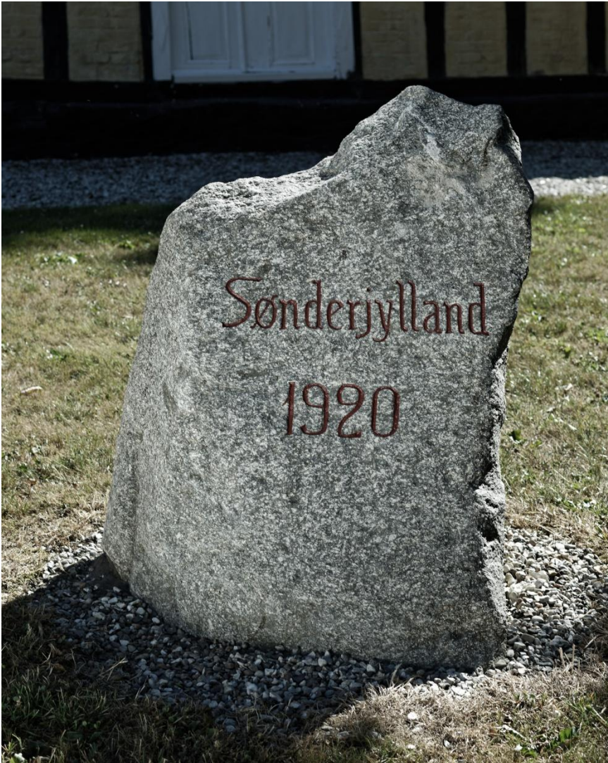
Lemmer-stenen efter nyopmaling, juni 2018.

Indskriften er hugget af J. P. Jacobsen, Mørke.