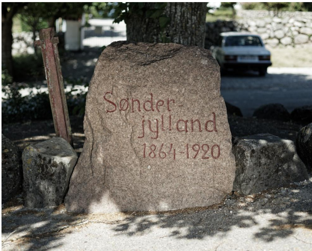
Koed-stenen efter nyopmaling, juni 2018.

Indskriften er hugget af J. P. Jacobsen, Mørke.