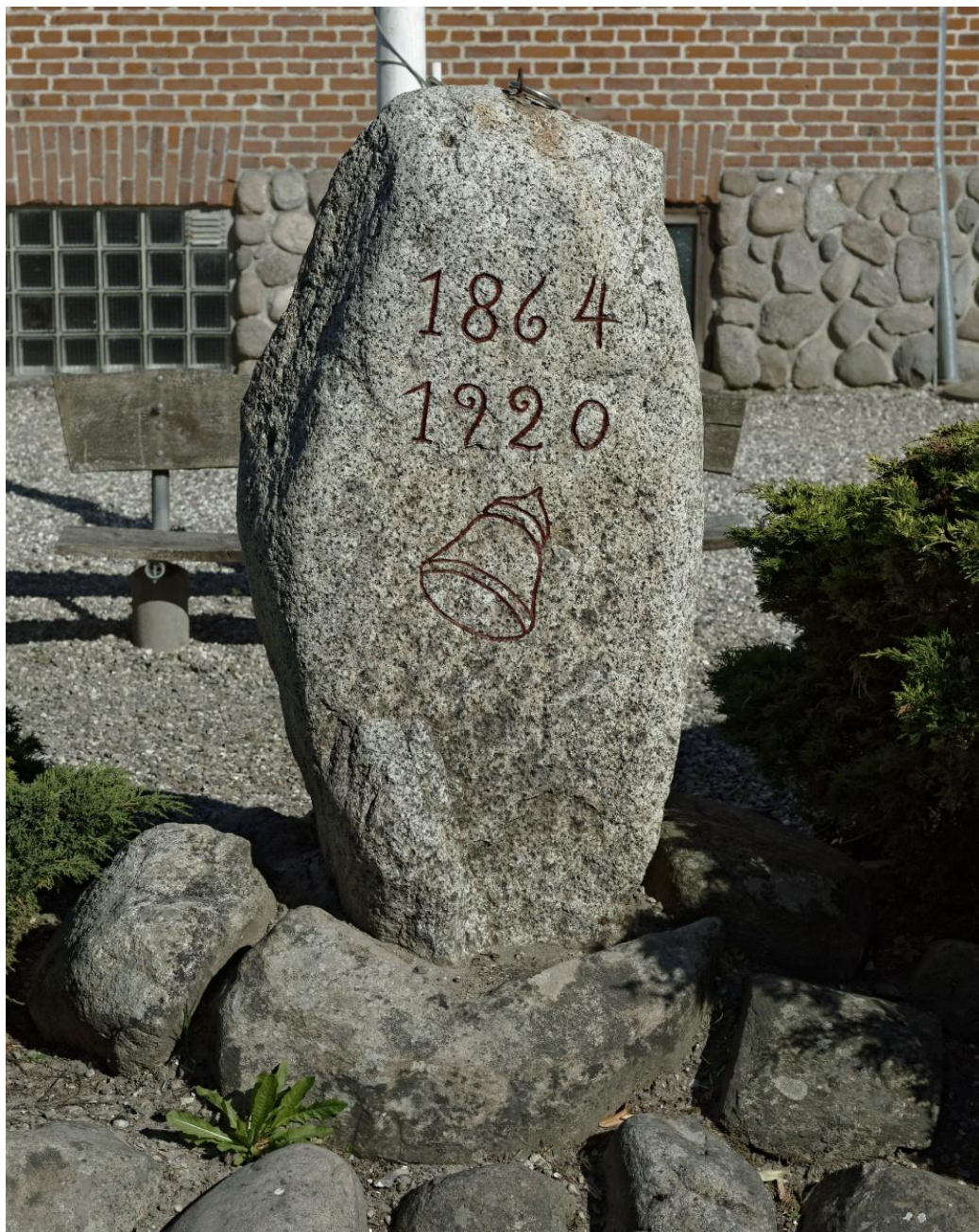
Lime-stenen efter nyopmaling, juni 2018.

Indskriften stod med 2-3 lag af sort bemaling. Malingen var afskallende og mangelfuld. Under de sorte lag fandt jeg små rester af rød og blå maling. Den røde fandtes kun i indhugningen, mens den blå lå som små pletter rundt på stenen, og derfor formodes at være spildt udover stenen en gang i tiden. Løs og afskallende maling, og maling, der lå udover indhugningens kanter blev fjernet med malingsfjerner (Nitromors). Der blev efterladt rester af tidligere bemalinger, så man kan vende tilbage og se, at indskriften tidligere har været rød og sort. Stenen blev vasket for lav, alger og mos med vand og børste.