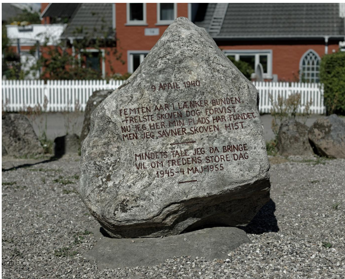
Stabrand-stenens bagside efter nyopmaling, juni 2018.

Naboen, som jeg desværre ikke fik noget navn på, kunne fortælle, at stenkredsen er blevet påkørt og genforeningsstenen væltet, mens han har boet nabo til stenen. Han var selv med til at rejse den op, og lykkeligvis tog den ingen skade