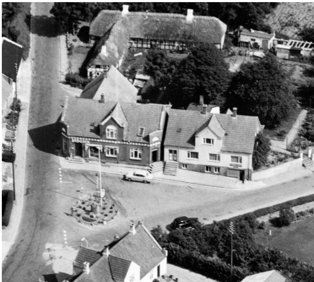
Figur 7, Nimtofte-anlægget set fra luften, 1960.