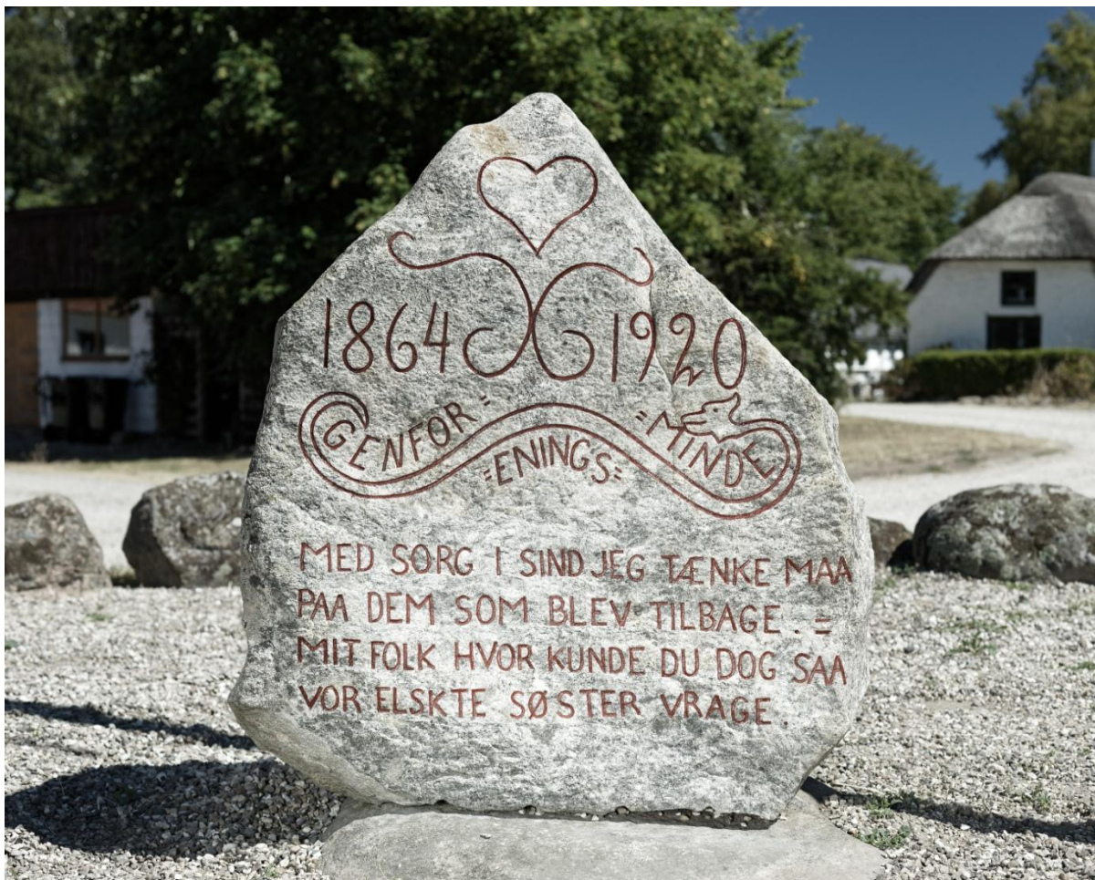
Stabrand-stenens forside efter nyopmaling, juni 2018.

Stenen er forvitret i overfladen og bagsiden er under kraftig nedbrydning. Stenen er overgroet med Sort Foldekantlav, en lav, der lever inde i stenen og forårsager alvorlig fysisk og kemisk nedbrydning. Det bedste man kan gøre for at bevare mindestenen, er at holde opmalingen ved lige, så man ikke mister kendskab til indhugningens ordlyd og udformning. Bagsidens indhugning er så godt som væk, men heldigvis har man malet teksten op igennem årene, og indskriften er nu bevaret som maling, der stikker op over stenens overflade. Indskriften er ifølge Kurt Soelberg, nabo til stenen, genopmalet to gange med sort maling mellem 1955 og i dag.