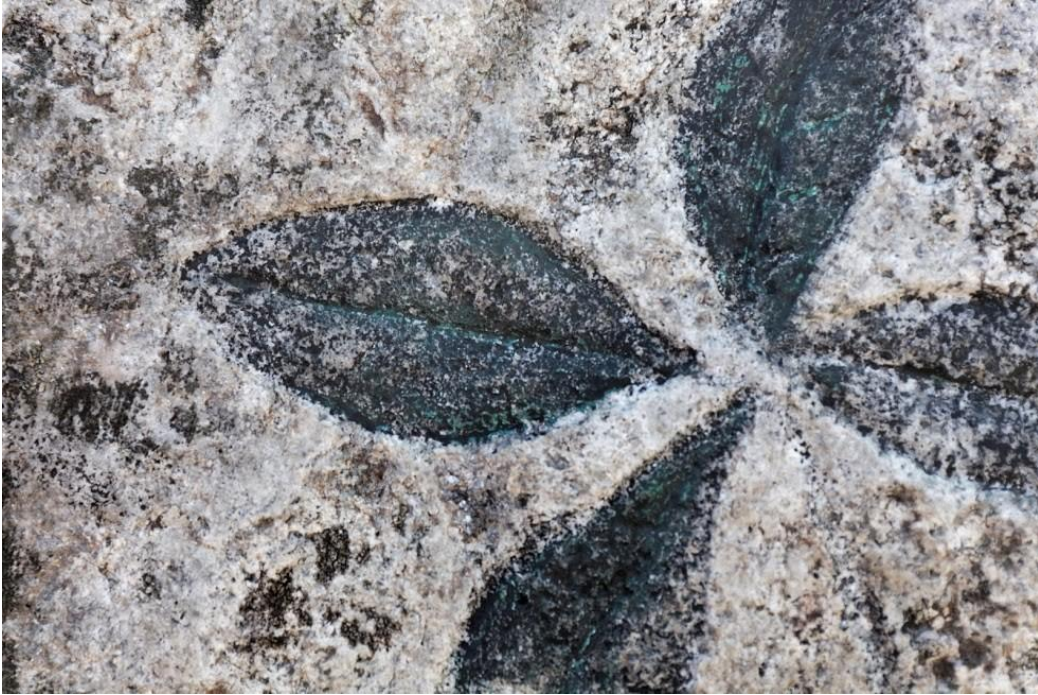
Figur 4, rester af grøn maling på kløverblad.

Jeg fik tilladelse fra Thomas Knudsen, formand for Hvilsager Beboerforening, til at genopmale stenens indskrift med rød farve og kløverbladet med grøn farve. Der er malet to lag med henholdsvis Persisk rød og Oxydgrøn linoliemaling fra Linoliebutikken i Højbjerg ved Aarhus. Anlægget omkring stenen er smukt tilplantet med stauder og lavt bunddække foran stenen.