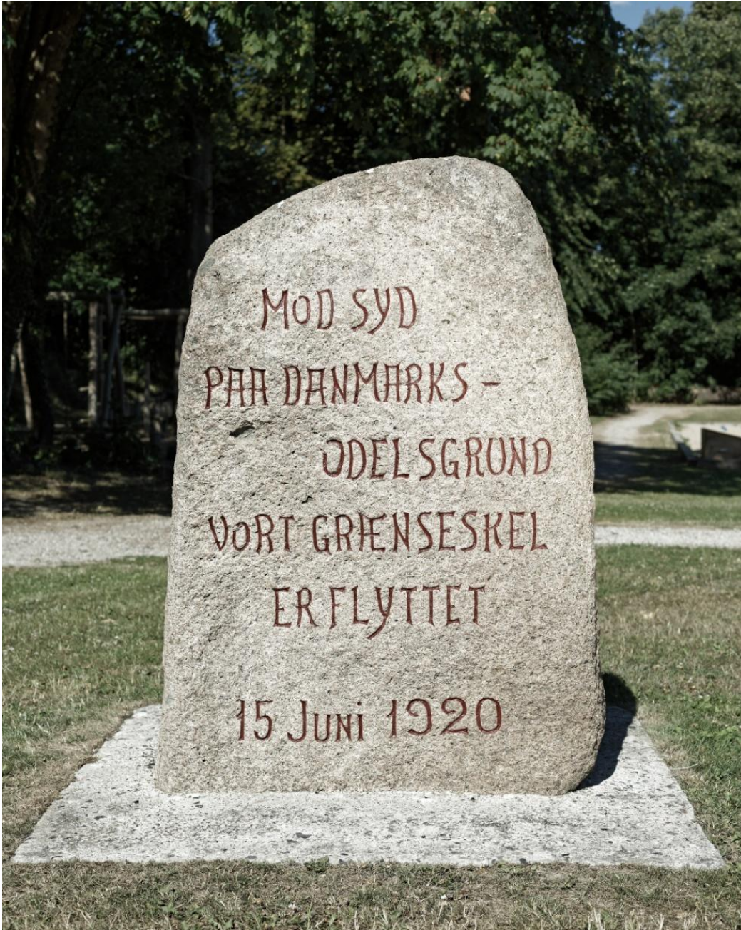
Mørke-stenen efter nyopmaling, juni 2018.

Indskriften er hugget af J. P. Jacobsen, Mørke.