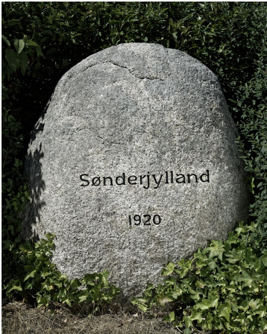
Ryomgård-stenen efter nyopmaling 2018.