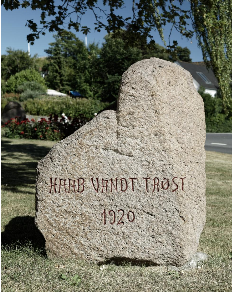
Rønde-stenen efter nyopmaling, juni 2018.

Indskriften er hugget af J. P. Jacobsen, Mørke.