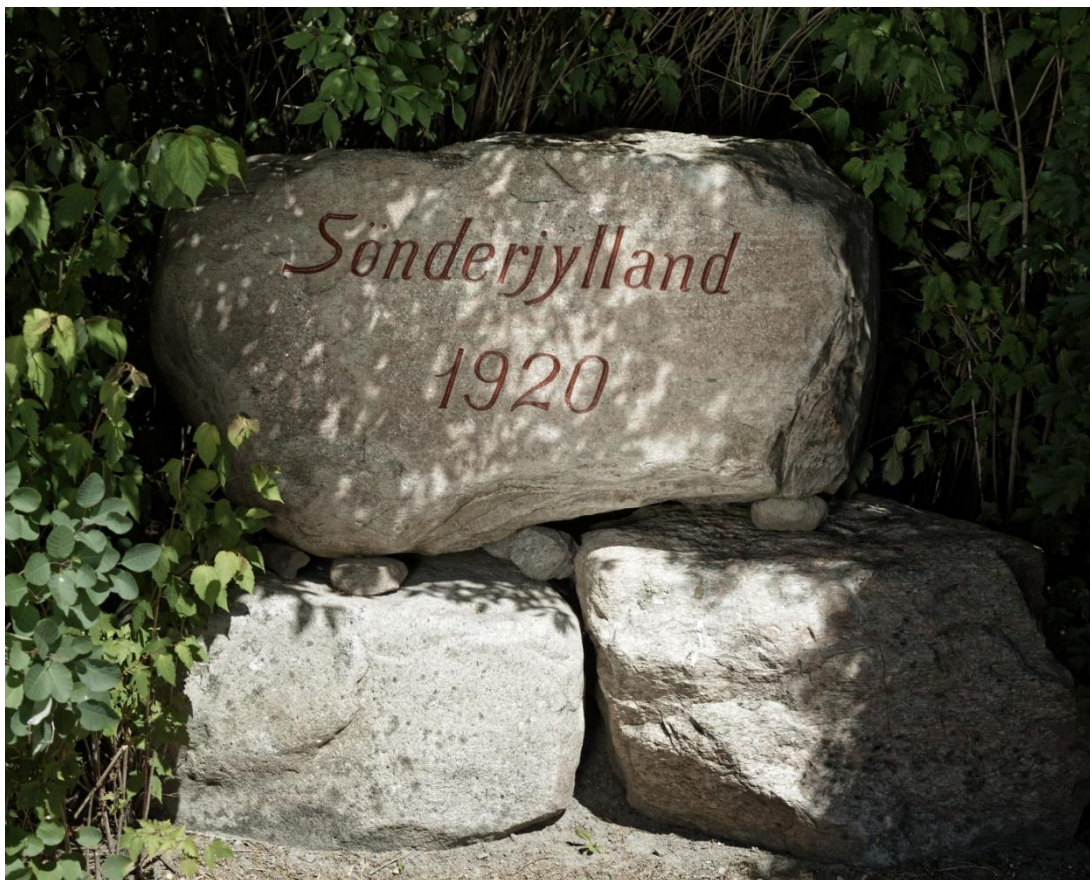
Marie Magdalene-stenen efter nyopmaling, juni 2018.

Indskriften er hugget af J. P. Jacobsen, Mørke.