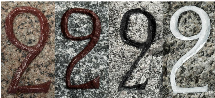
Figur 1, Jacobsens signatur-2-tal på stenene i Koed, Lemmer, Nimtofte og Syvveje.

han har taget stenen i øjesyn, skitseret op med fri hånd, og så grebet hammer og mejsel. Samme bogstav kan være hugget forskelligt ned igennem teksten, bogstaverne kan hoppe på linjen, hælde lidt i forhold til hinanden, og alligevel er slutresultatet harmonisk og flot.