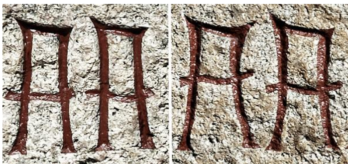
Figur 2, dobbelt-A på Mørke-stenen og Rønne-stenen.