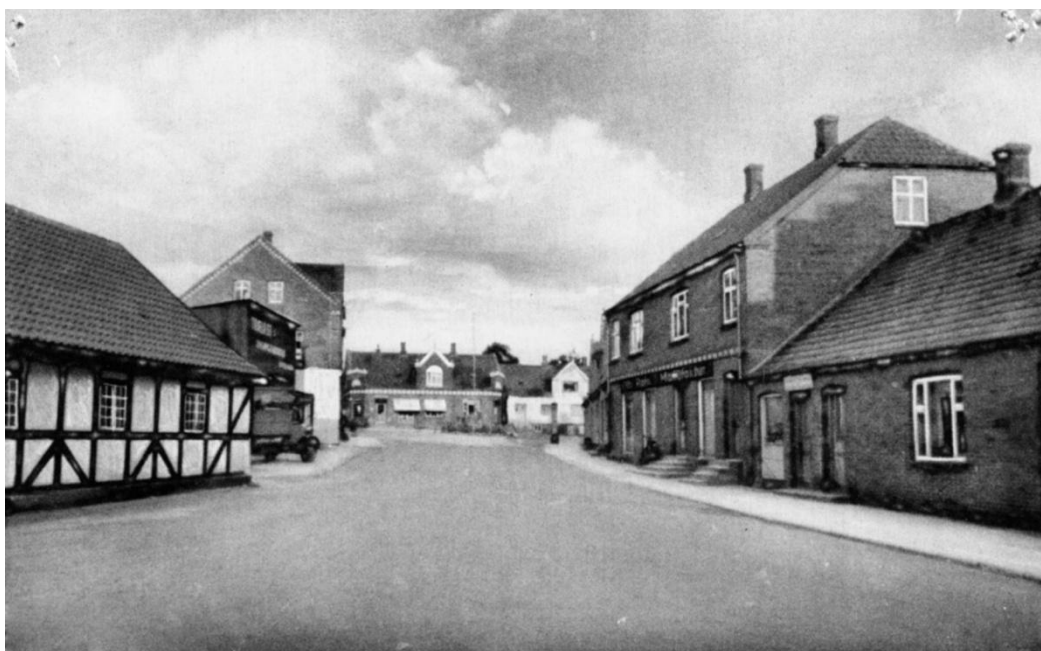
Figur 6, Nimtofte-stenen midt i billedet fra 1957. Man kan ane de lodrette stolper i stakittet.

Jeg har tidligere troet, at stenkredsen var fra 1920. Allerede på det første møde med borgerne fik jeg et gammelt foto at se, hvor stenen står bag et jernstakit. Billedet var fra omkring 1935. Jeg har fundet flere og senere fotos på arkiv.dk; ét fra 1945, hvor anlægget er indhegnet af jernstakit og genforeningsstenen står midt på en stensat, beplantet jordforhøjning (se figur 5), og ét fra 1957, hvor man kan ane de lodrette stolper i jernstakittet (se figur 6). Og endelig et luftfoto fra 1960, hvor man kan se et nyanlagt anlæg med små buske og stenkreds, behængt med kæde (se figur 7).