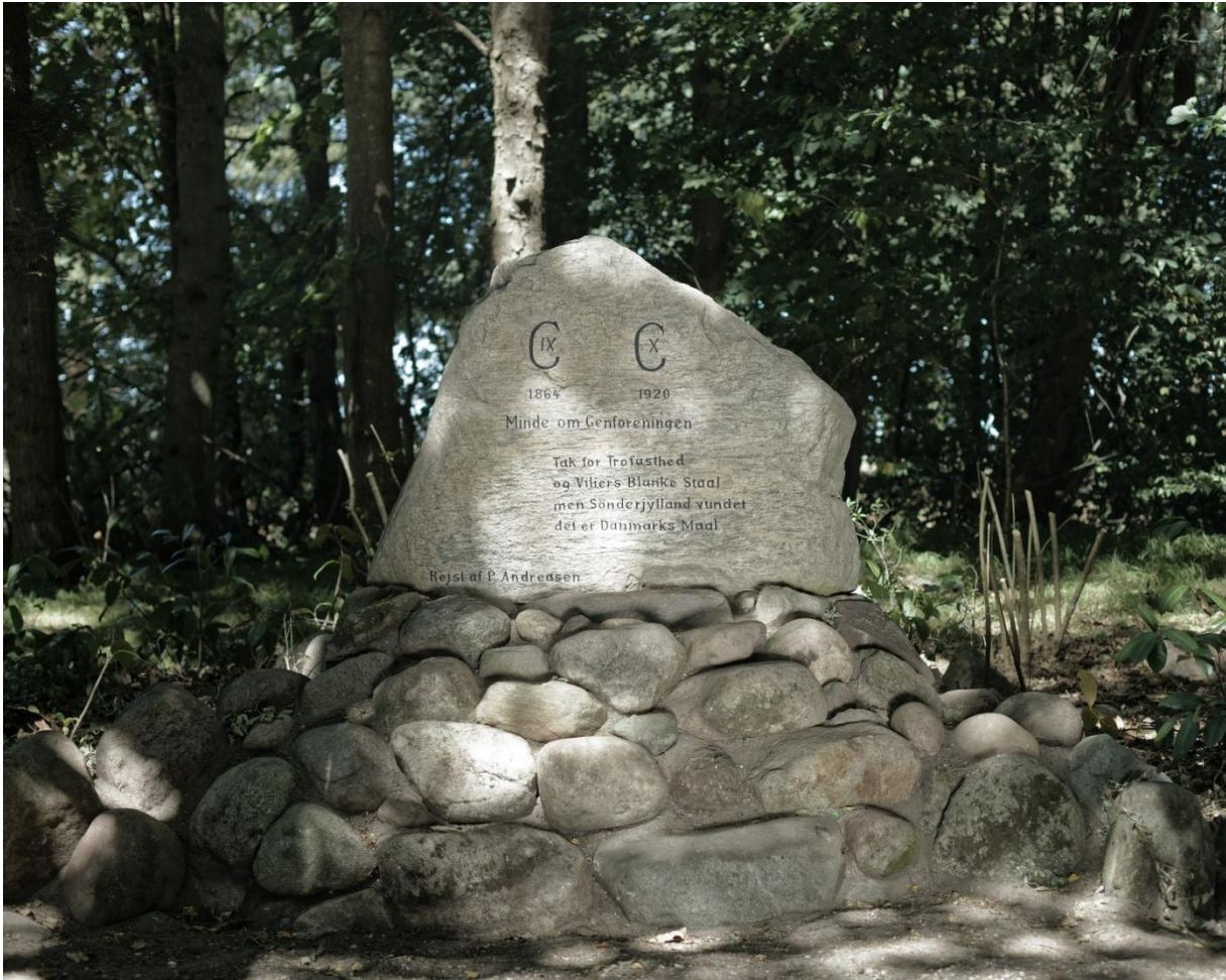
Fuglslev-stenen nyopmalet og med nylagt røse, juni 2018.

Stenens indskrift havde ét rimeligt velbevaret lag af sort maling. Stenen er en finlamineret gnejs med lagene parallelle med indskriftsfladen. Indskriften er hugget ned igennem det yderste lyserøde lag til det underliggende lag af mørke mineraler, og jeg forestiller mig, at man har udnyttet denne farveforskel og derfor ikke har malet indskriften op i første omgang. Senere er stenens overflade forvitret, og indskriften er blevet svær at tyde, hvorefter man har opmalet med sort. Det er uvist, hvem stenhuggeren er. Stenen er først opstillet i 1934 og er kommunens yngste genforeningssten. Som støtte for genforeningsstenen var en jordlagt stenrøse, som var sammenfalden og udskredet. Vi besluttede at omlægge røsen fra bunden af for samtidig at undersøge fundamentets stabilitet. Stenen viste sig at være nedstøbt i en kasseformet cementblok med tilstøbte marksten på siderne og med en række tilstøbte sten øverst for og bag. Resten af røsen var lagt i grusblandet muld. På et ældre foto fremstår røsen meget stejl, og man kan se, at der ikke går ”vinger” ud fra hjørnerne som der gør i dag (se figur 3). Røsen er nok ret tidligt begyndt at falde sammen, og man har derfor støttet hjørnerne ved at lægge store sten op. Cementblokken er stabil og i god stand.