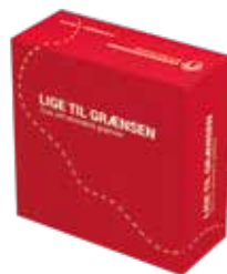
Quizspillet 'Lige til Grænsen'.

* Note, 25. august 2021: På grund af en teknisk fejl var der i den tidligere udsendte årsberetning angivet forkerte medlemstal. Her fremgik det, at det samlede medlems-tal lå på 9.776 med en nettotilgang på 76 nye medlemmer. Medlemstallet ligger dog på 10.028 med en nettotilgang på 840 medlemmer i 2020. Tallene er rettet i den her foreliggende udgave af årsberetningen.