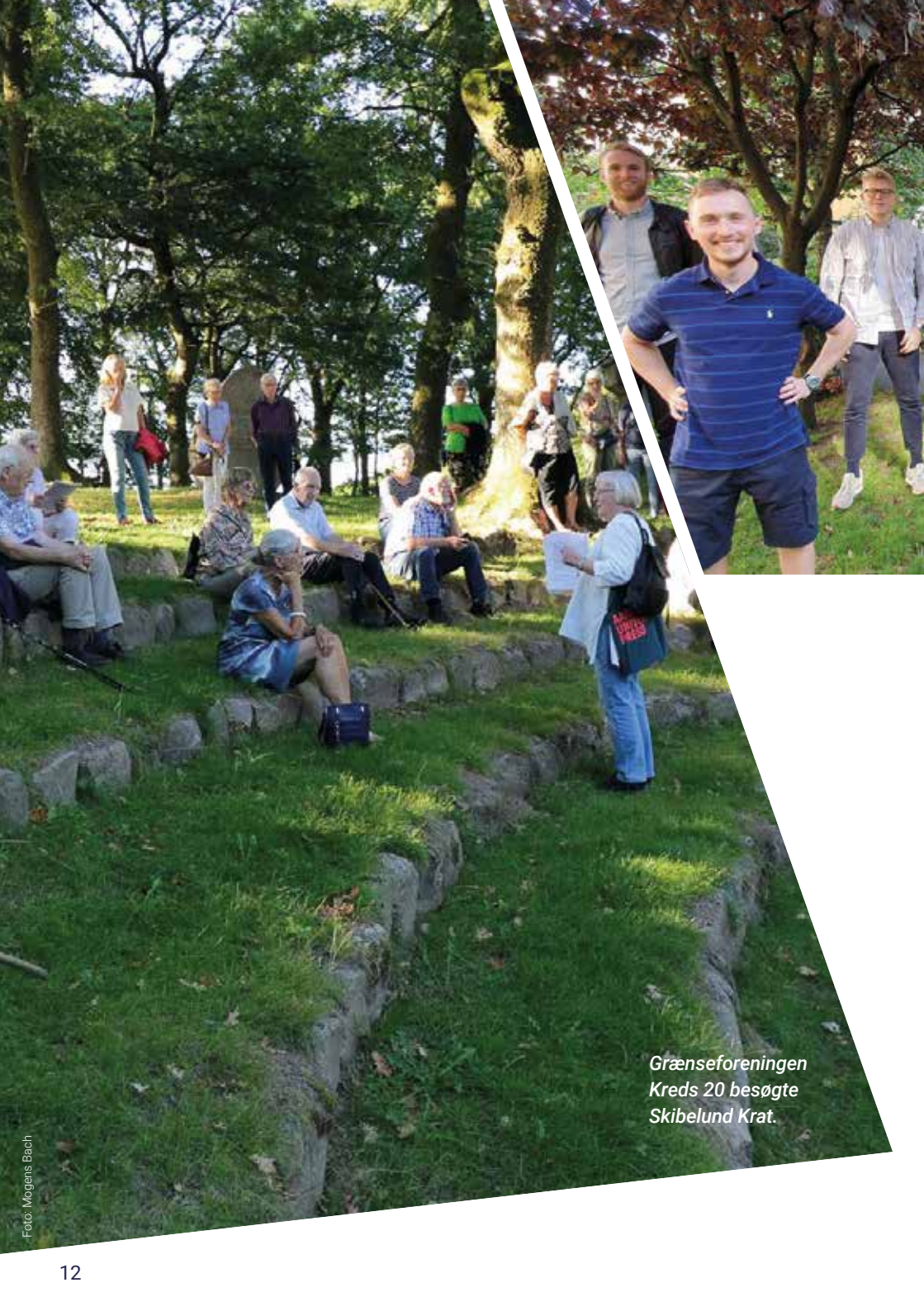
Grænseforeningen Kreds 20 besøgte Skibelund Krat.