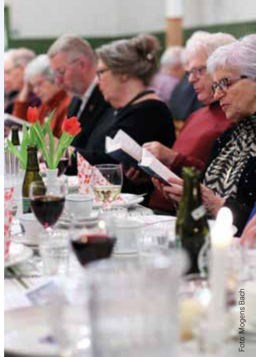
Afstemningsfest i Balle Forsamlingshus den 10. februar, med bl.a. Grænseforeningen Vejle Vestereg.

det ikke var muligt at samles fysisk. Med ønsket om at skabe udvikling sammen med lokalforeningerne organiseredes Idebryggeriet, som dog blev aflyst.