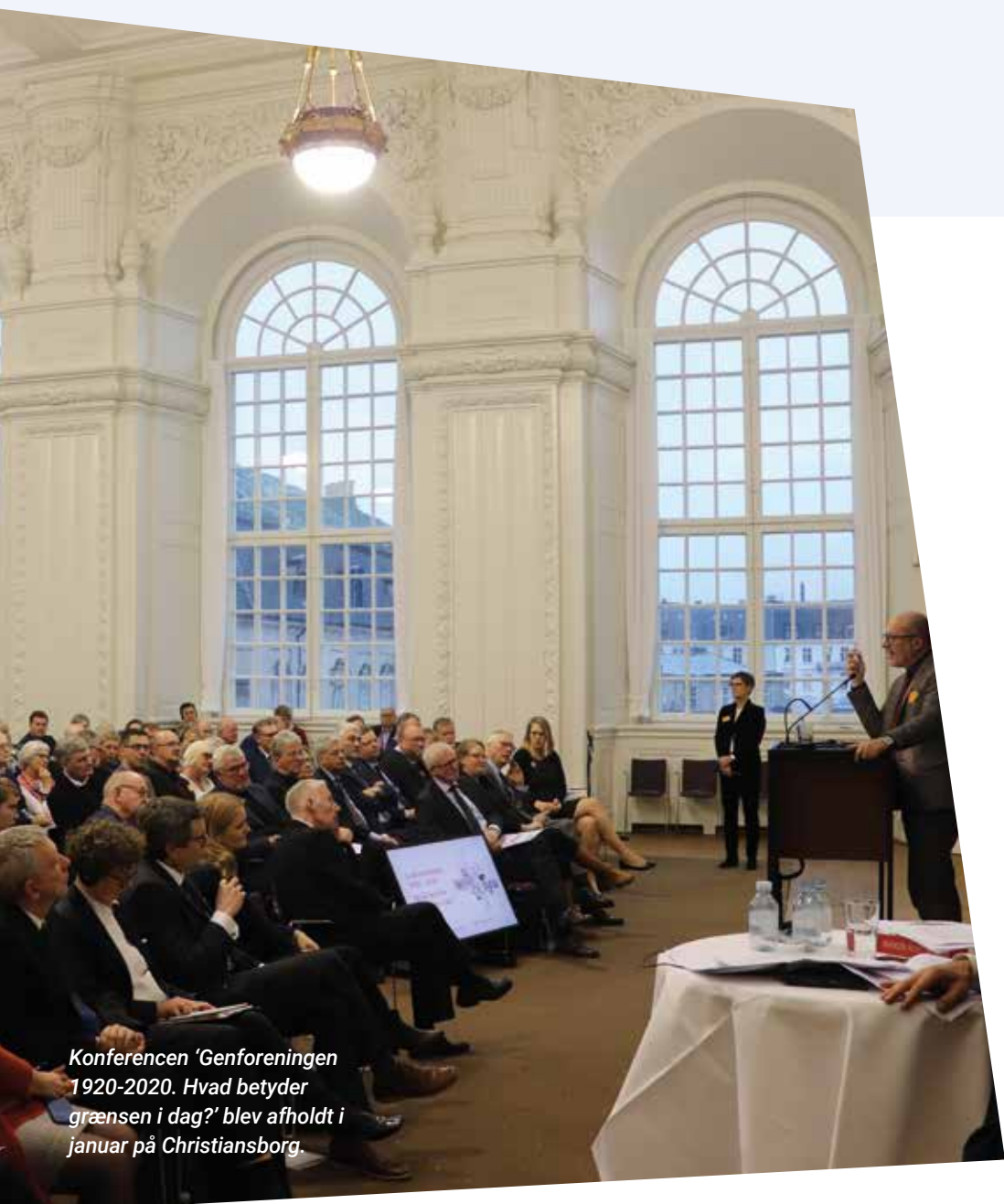
Konferencen 'Genforeningen 1920-2020. Hvad betyder grænsen i dag?' blev afholdt i januar på Christiansborg.