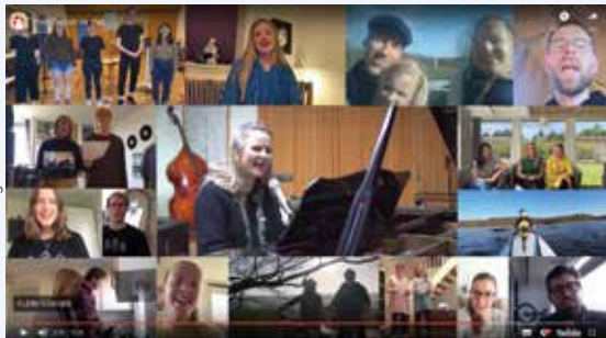
Genforeningssangen 'Hver dag en ny dag' blev opført af lærere og elever på Silkeborg Højskole i en onlinevideo.