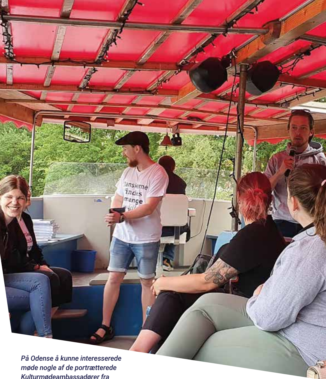
På Odense å kunne interesserede møde nogle af de portrætterede Kulturmødeambassadører fra bogen 'Danskerne findes i mange modeller'