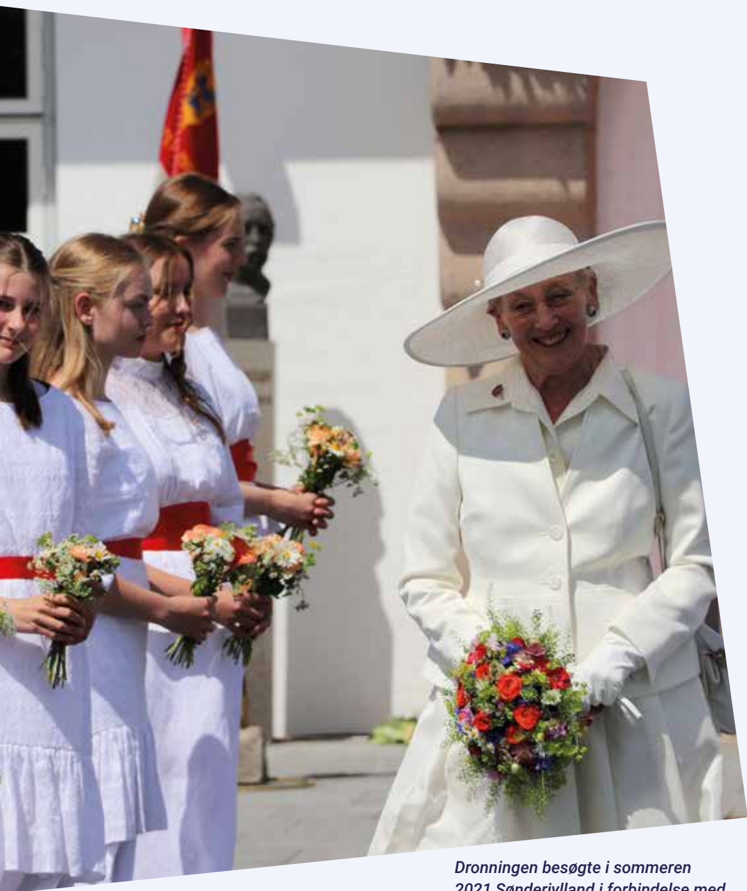
Dronningen besøgte i sommeren 2021 Sønderjylland i forbindelse med den coronaudsudte fejringen af 100-året for Genforeningen. Her ses Dronningen i Aabenraa.