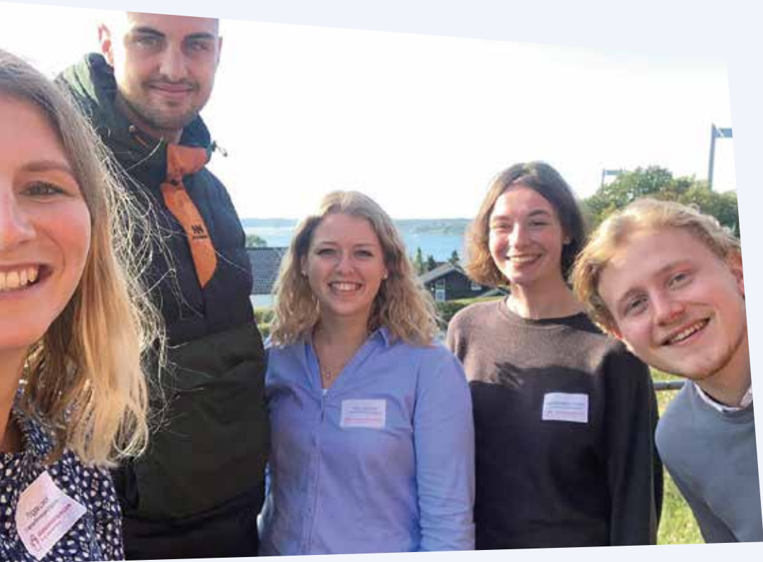
En del af Grænseforeningen Ungdoms bestyrelse deltog i Grænseforeningens Idébryggeri i Middelfart