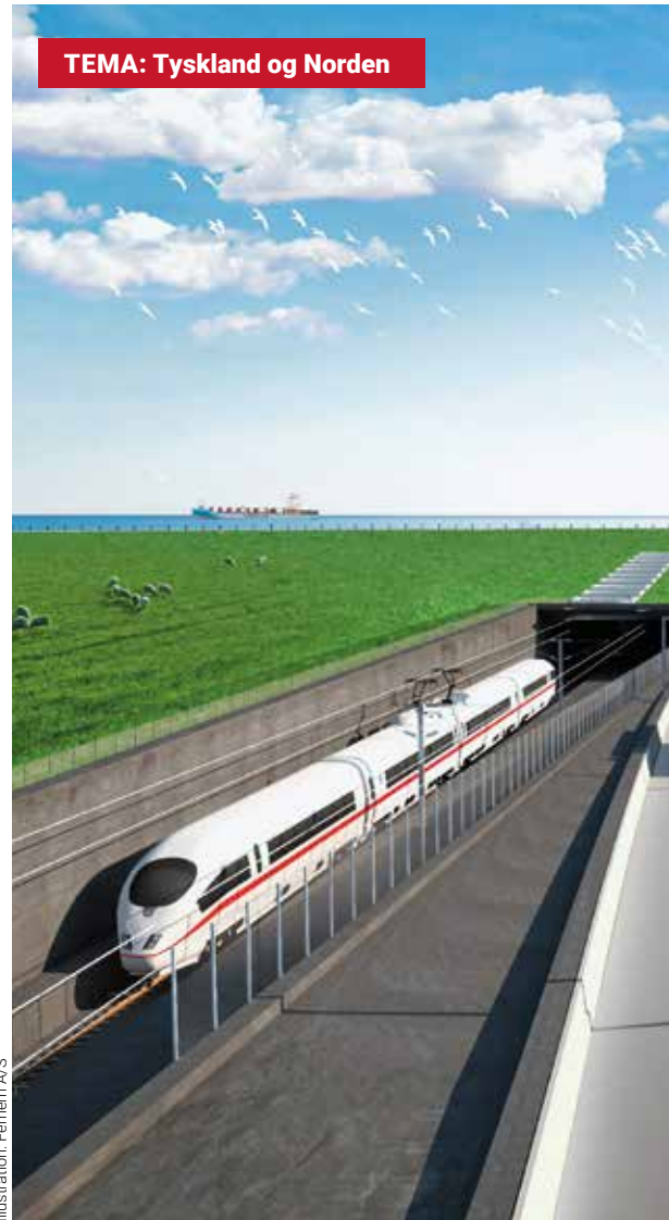
Illustration: Femern A/S