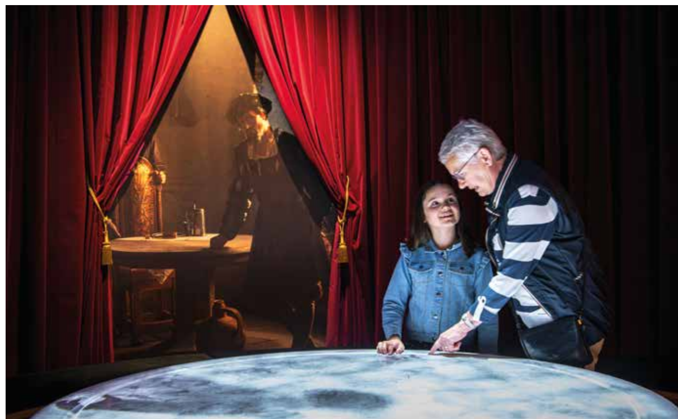
Museum Sønderjylland formidler viden, der er vigtig for både landsdelen og for forståelsen af Danmark i dag.

”Vi har kompenseret for det, der har manglet, ved at foretage en løbende tilpasning siden 2010, ligesom andre kulturinstitutioner har gjort. Og det har været en