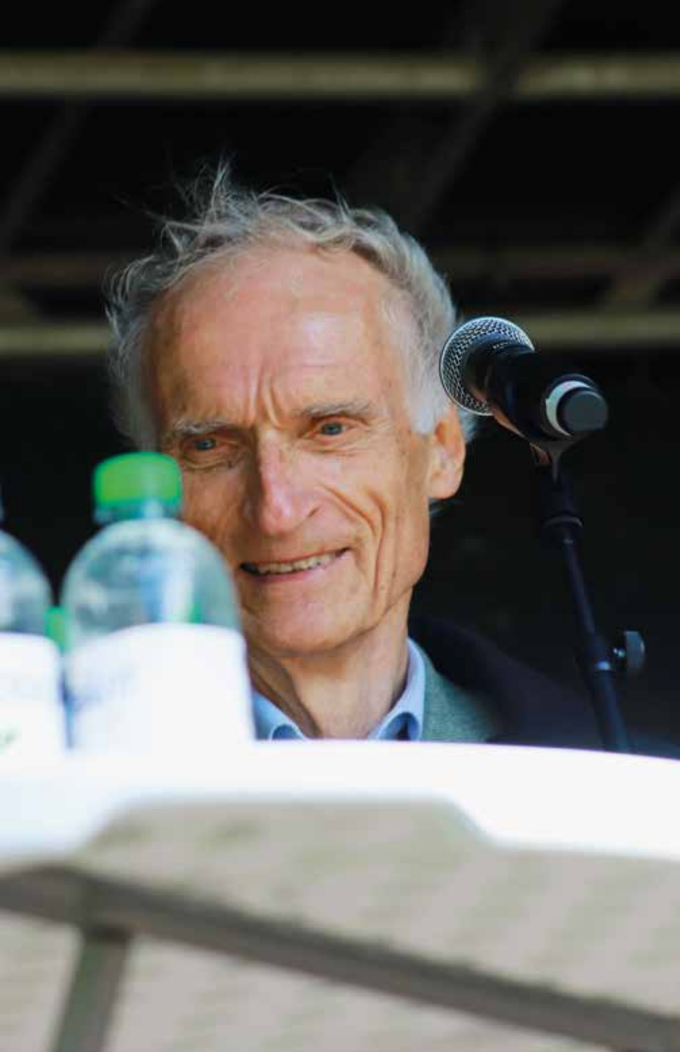
Bertel Haarder (V) er en markant politiker.

eningen i 1920 og København-Bonn-erklæringerne fra 1955, som er af uvurderlig betydning for de gode naborelationer mellem Danmark og Tyskland i dag. De så frem i overvejelser om, hvorvidt den demokratiske grænse kunne være til inspirationen for en løsning i Donbass i Ukraine. I nutiden var der enighed om det smukke i forholdet mellem Danmark og Tyskland, men da