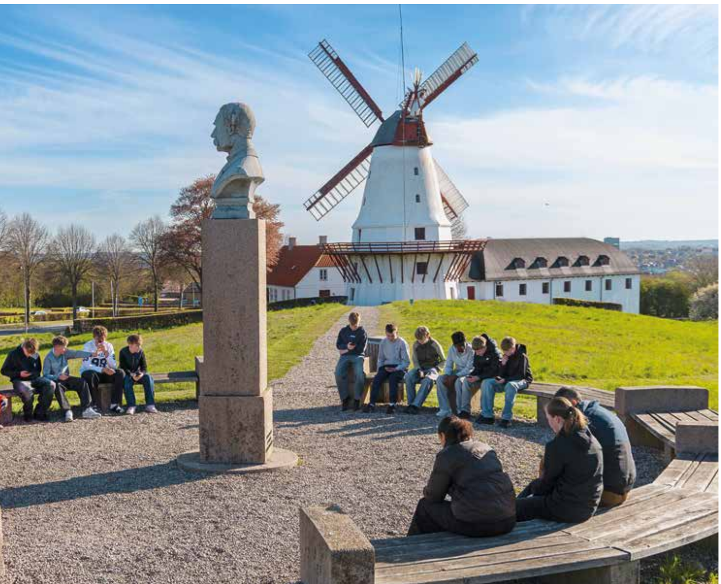
Elever fra 7.B på Dybbølskolen fortæller, at det er dejligt at komme ud af klassen, at være der og se, hvor det er sket.

Af Poul Struve Nielsen