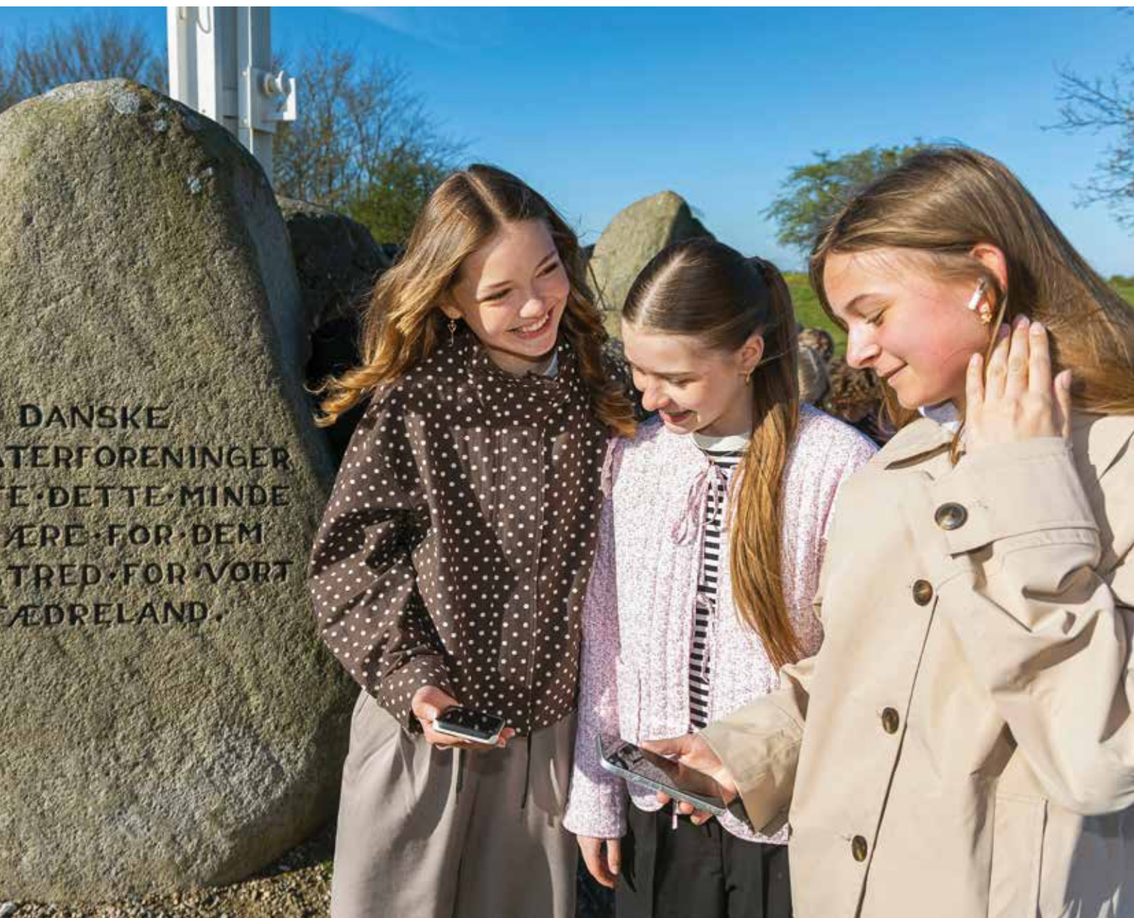
Kanonild, lærkesang og råb fra sårede soldater er alt sammen ting, eleverne kan opleve.